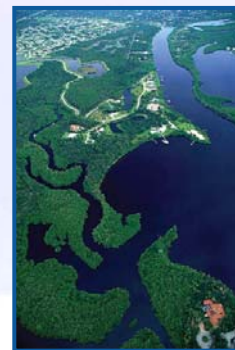
Rivye Indian Lagoon